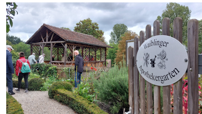
„Questo va bene per farmi guarì“